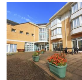
EHPAD Le Château des Dunes